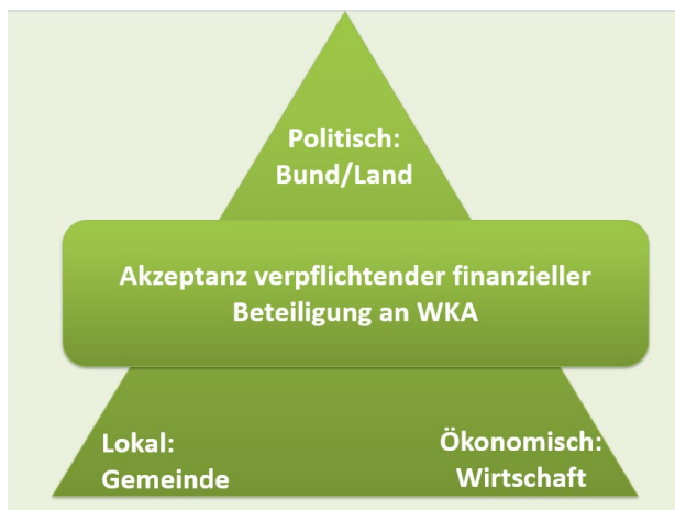
Abbildung 5: Dreidimensionales Akzeptanzdreieck nach Wüstenhagen et al. (2007); Devine-Wright et al. (2017).

Finanzielle Beteiligung wird insgesamt sehr positiv eingeschätzt. Allerdings kommt es auf die Art der Beteiligung an. Nicht jede Form der finanziellen Beteiligung eignet sich in allen Kontexten. Um einem verkürzten Verständnis von Akzeptanz als Legitimationsbeschaffung für neue und ungewohnte Infrastruktur vorzubeugen, sollen die bisherigen Ergebnisse entlang des dreidimensionalen Konzepts sozialer Akzeptanz, das von Wüstenhagen und Kolleg*innen etabliert wurde 90 , rekapituliert werden. Das Konzept basiert auf den Säulen sozio-politischer, ökonomischer und lokaler Akzeptanz (siehe Abb. 5). Wir folgen der Interpretation von Devine-Wright et al. 91 und definieren politische Akzeptanz als Akzeptanz durch politische Entscheidungsträger*innen, die sich in regulatorischen Rahmenbedingungen niederschlagen kann. Ökonomische Akzeptanz beschreibt Akzeptanz durch Wirtschaftsakteure und umfasst im vorliegenden Fall die Sicht von Unternehmen und die Entwicklung des Ausbaus. Lokale Akzeptanz bezieht sich auf die Akzeptanz von Energiewendeinfrastrukturen in den betreffenden Gemeinden. Hierunter werden auch die Aspekte der Verteilungs- und Verfahrensgerechtigkeit sowie des Vertrauens gefasst 92 .